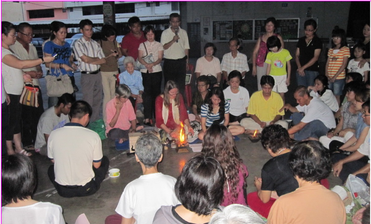
La foto muestra la presentación Homa y Agnihotra en la escuela en Muar el 29 de junio.